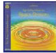
CD Spacy Dreams